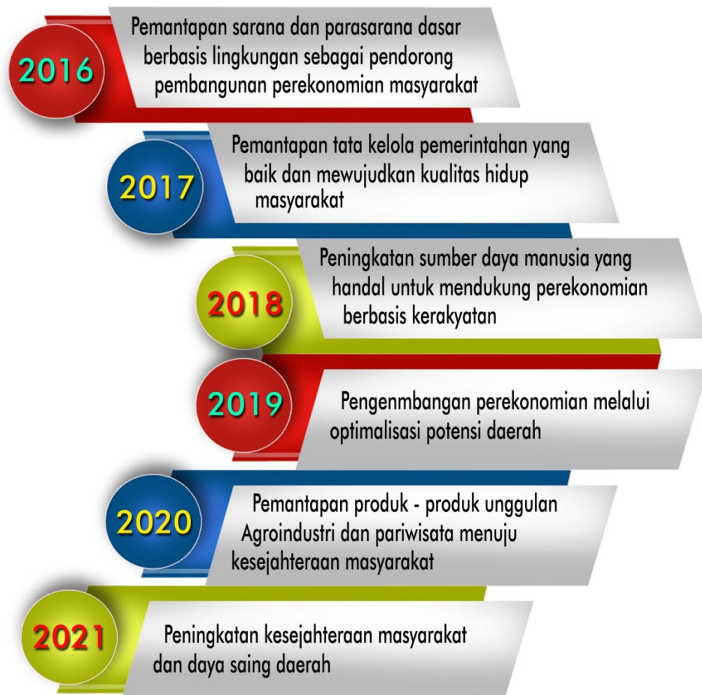
Gambar 6.1. Fokus/Tema Pembangunan Kabupaten Lamongan Tahun 2016-2021

Rumusan arah kebijakan ini berfungsi untuk merasionalkan pilihan strategi agar memiliki fokus dan tujuan sesuai dengan pengaturan pelaksanaannya. Penekanan fokus atau tema dalam setiap tahun selama 5 (lima) tahun memiliki kesinambungan dalam rangka mencapai visi, misi, tujuan, dan sasaran yang telah ditetapkan. Fokus atau tema pembangunan Kabupaten Lamongan dapat dilihat pada Gambar 6.1. sebagai berikut: